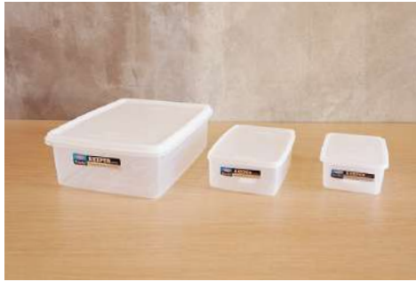
キーパー3種 数量：L 3個 / M 1個 / S 2個