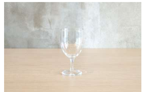
ゴブレットグラス