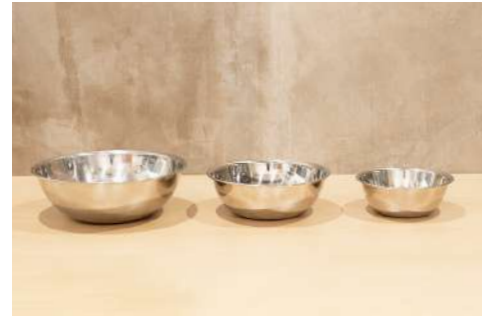
ミキシングボウル3種 数量：各2個 規格：L 28cm / M 27cm / S 21cm