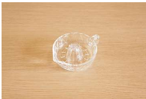
レモン搾り器 数量：1個