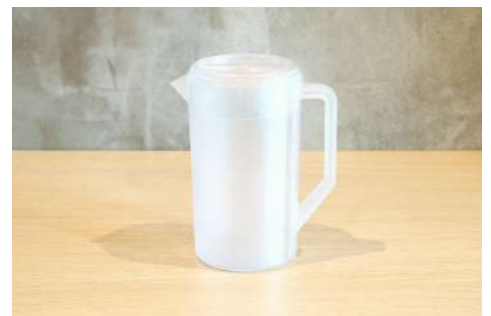
ピッチャー 数量：1個 容量：2.3L