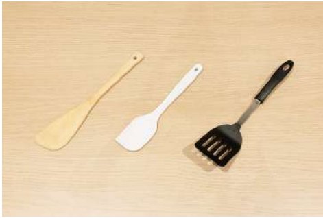
木ベラ/ゴムベラ/フライ返し 数量：各1本