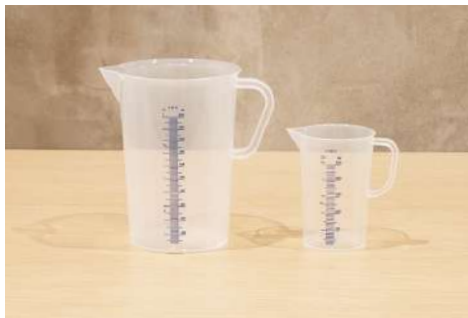
軽量カップ2種 数量：各1個 容量：2L / 500cc