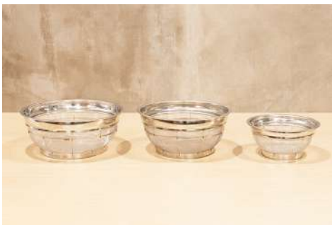
ザル3種 数量：各2個 規格：L 31cm / M 27cm / S 20cm