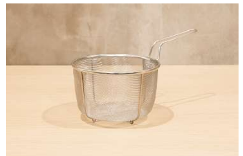
ボイルバスケット