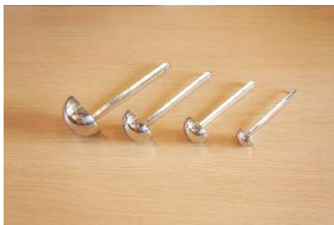
レードル4種 数量：360cc1個 / 180cc2個 / 90cc2個 30cc2個