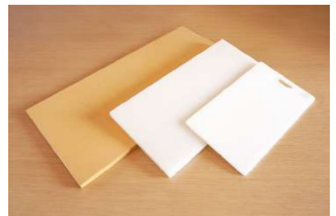
まな板3種 数量：L 1枚 / M 2枚 / S 1枚