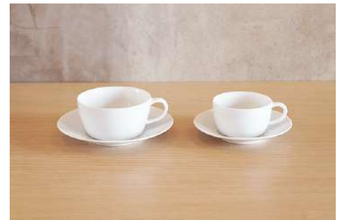
カップ・ソーサー2種