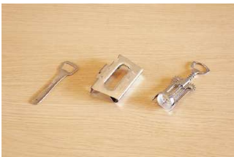
栓抜き / 缶切り / ワインオープナー 数量：各1個