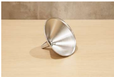
ロート 数量：1個 規格：直径18cm