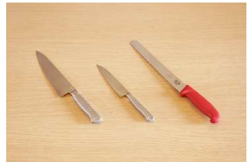
包丁3種 数量：万能ナイフ2本 / ペティナイフ2本 パン切りナイフ1本