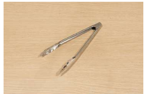
万能トング 数量：3本