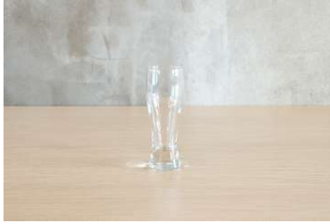
タンブラーグラス