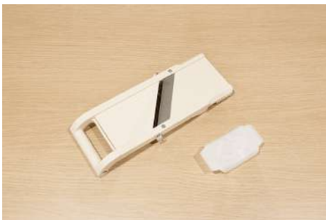
スライサー 数量：1個