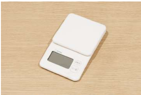
デジタルスケール 数量：2個