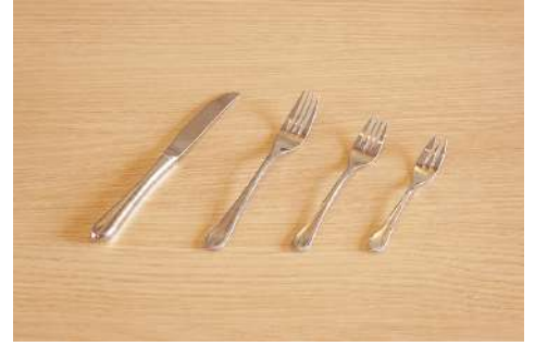
ナイフ・フォーク3種