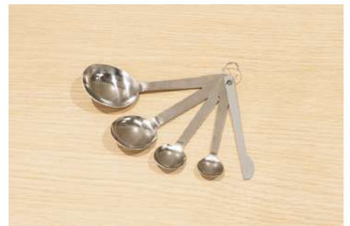
軽量スプーン4本組 数量：2個