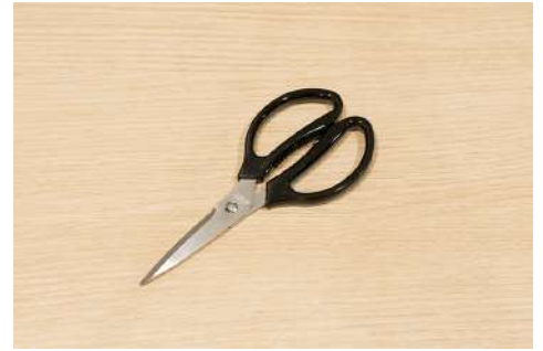
キッチンバサミ 数量：1個