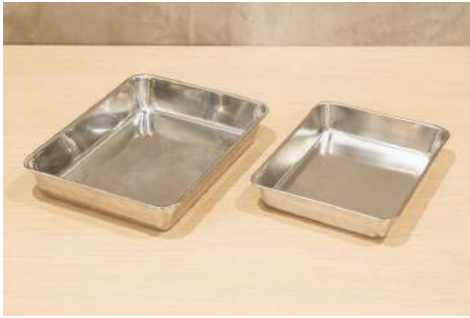
各バット2種 数量：各1個